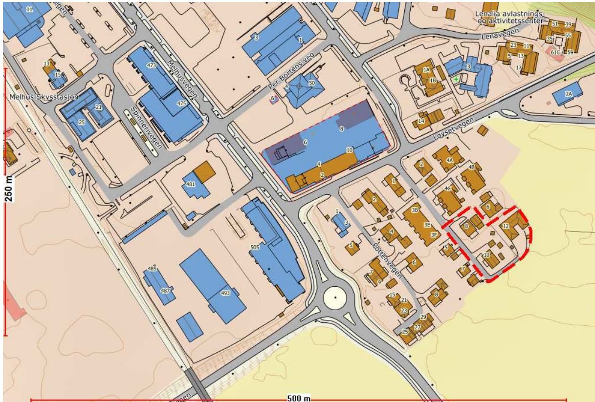
Avmerket planområde (rød stiplet linje)